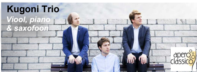
Kugoni Trio Viool, piano & saxofoon

Triunfal Quintet is een collectief van vijf jonge, gepassioneerde muzikanten. Hun intens samenspel neemt u mee naar de pracht van tangomuziek. Samengesteld uit klassiek geschoolde en jazzmuzikanten vindt de groep een gemene deler in de Argentijnse Tango Nuevo van Piazzolla. Daarnaast brengen ze werk van enkele Belgische componisten.